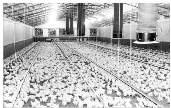
위생적인 관리 시스템을 갖춘 한 양계장.